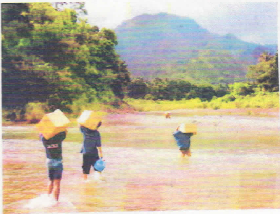
川を渡って本を届ける