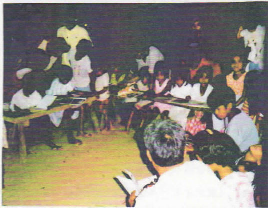
初めて本に出会った子どもたち