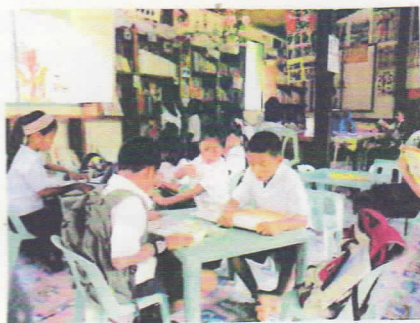
本はみんなの宝 今日もたくさん 子どもたち