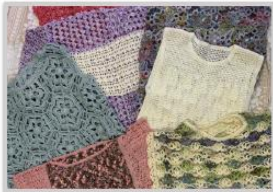
縫針編みのカーティガン・ベスト等、さまざまなサマーニットを揃えています。