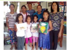
(翻訳ラベル作成する作業の内容)

支援1 タガログ語紙原稿から絵本用の翻訳ラベルを作成します (指定で作成した紙の翻訳原稿から絵本用のラベルを作成する作業です)