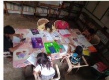
(紙翻訳をデータ化する作業の内容)

支援1 タガログ語紙原稿から絵本用の翻訳ラベルを作成します (指定で作成した紙の翻訳原稿をデータ化し、翻訳ラベルを作成する作業です)